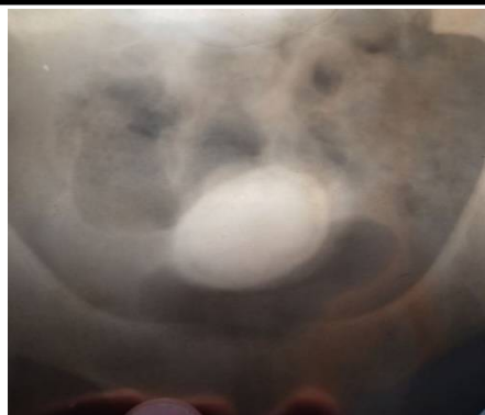
Рис.2. Больная А-ва, 19 лет. Обзорная урограмма: тень конкремента на проекции мочевого пузыря.

Диагноз: Рубцевание мочеиспускательного канала и преддверия влагалища, камень мочевого пузыря.