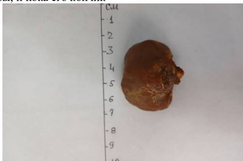
Рис.3. Та же больная. Макропрепарат: камень, удаленный из влагалища.

Было обнажено наружное отверстие уретры и влагалище, во влагалище находился большой камень. Камень из влагалища был удален. Размеры его составляли 2x3 см, он имел овальную форму и темный цвет. (рис.10.) Из влагалища удален камень размером 2–3 см (рис. 3).