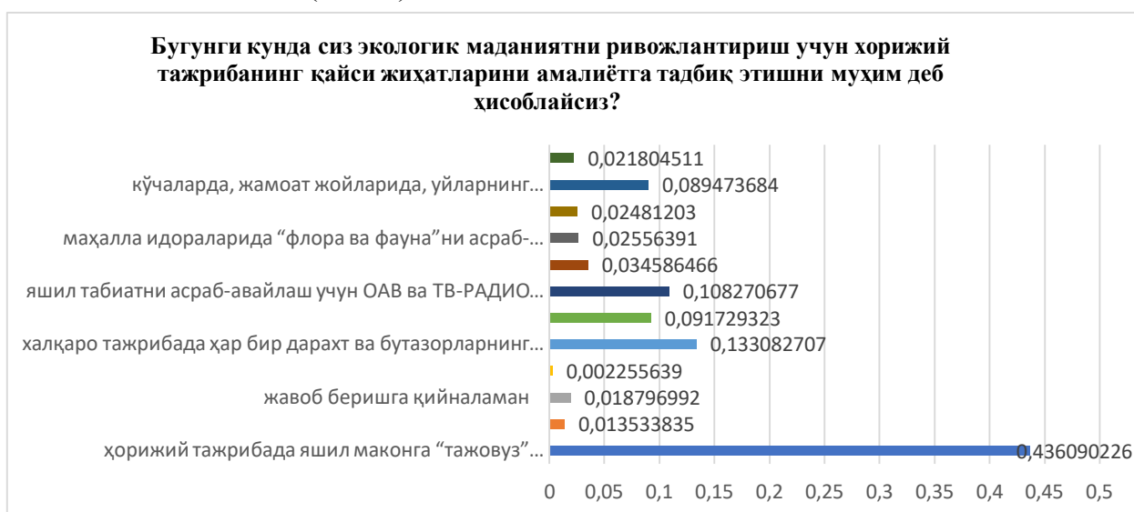
2-rasm. Bugungi kunda siz ekologik madaniyatni rivojlantirish uchun horijiy tajribaning qaysi jihatlarini amaliyotga tadbiiq etishni muhim deb hisoblaysiz?

“Bugungi kunda siz ekologik madaniyatni rivojlantirish uchun xorijiy tajribaning qaysi jihatlarini amaliyotga tadbiiq etishni muhim deb hisoblaysiz?” degan savol bilan murojaat etilganida jami respondentlarning 43,6 foizi “Horiijiy tajribada yashil makonga “tajovuz” qilganlarga juda katta miqdorda jarima solishadi, bizda ham allaqachon shu tajribani qo‘lashi kerak edi” javobini, ishtirokchilarning 13,3 foizi “Xalqaro tajribada har bir daraxt va butazorlarning maxsus pasporti mavjud, bu tizimni bizda ham tezlikda joriy etish kerak” javobini, fuqarolarning 10,8 foizi “Yashil tabiatni asrab-avaylash uchun OAV va TV-RADIO kanallarida maxsus alohida dasturlar sonini ko‘paytirish” degan fikrni, hamda 8,9 foiz ishtirokchilar “Ko‘chalarda, jamoat joylarida, uylarning pod‘ezdlarida tupurish, sigareta chekish, turli mayda chiqindilarni tashlab ketilishi kameralar kuzatuvida nazoratga olinib, jarimaga tortilishi kerak” degan fikrni va 2,6 foiz respondentlar “Mahalla idoralarida “flora va fauna”ni asrab-avaylash, himoya qilish va targ‘ib etishga oid volontyorlar guruhini barcha yoshdagi aholi qatlamlari orasidan shakllantirish” kabi fikr-mulohazalarni bildirishadi (2-rasm).