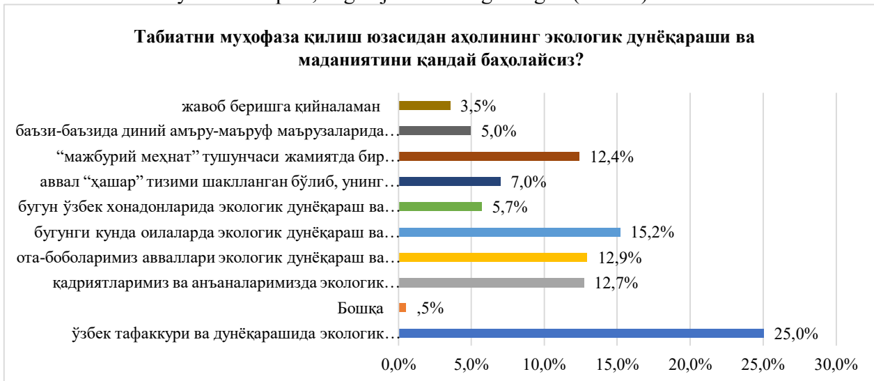
1-rasm. So'rovnoma ishtirokchilarining tabiatni muhofaza qilish yuzasidan aholining ekologik dunyoqarashi va madaniyatini qanday baholashi to'g'risidagi fikrlari

"Tabiatni muhofaza qilish yuzasidan aholining ekologik dunyoqarashi va madaniyatini qanday baholaysiz" degan savolga 25,0 foiz holatda "O'zbek tafakkuri va dunyoqarashida ekologik madaniyat masalalariga hamma vaqt alohida e'tibor berilib, ahamiyat qaratilgan"ligi ta'kidlangan bo'lsa, 15,2 foiz ishtirokchilar "Bugungi kunda oilalarda ekologik dunyoqarash va madaniyatga e'tibor nisbatan susayib bormoqda", degan javobni belgilashgan (1-rasm).