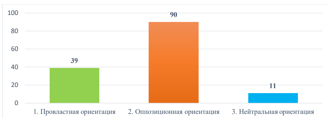
Рис.1. Политическая ориентация

Что касается Модальности текста, наибольшее количество комментариев содержит отрицательную модальность (73,6%). В контексте нашего исследования модальность является индикатором дискуссии в комментариях, также отрицательная модальность указывает на то, что пользователи активно обсуждают и высказывают разные мнения. Тенденция к отрицательной модальности сохраняется как у провластно ориентированных (87,2%), так и у оппозиционно ориентированных пользователей (69%), с одной лишь поправкой, что у пользователей оппозиционных взглядов немного меньше процент отрицательной модальности.