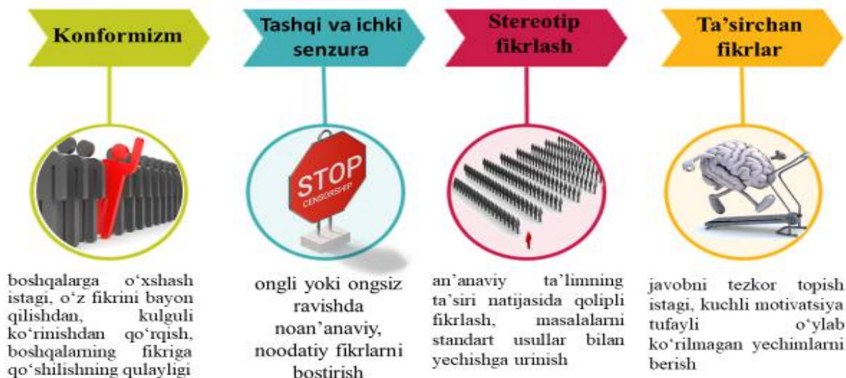
1-chizma. Kreativlik to'siqlari

Dayana Xalperi «Tanqidiy fikrlash psixologiyasi» kitobida tanqidiy fikrlash «fikir yuritishning shunday ko'rinishini anglatadiki, u vazminlik, mantiq va maqsadga yo'naltirilganlik bilan ajralib turadi», [3] deb yozadi.