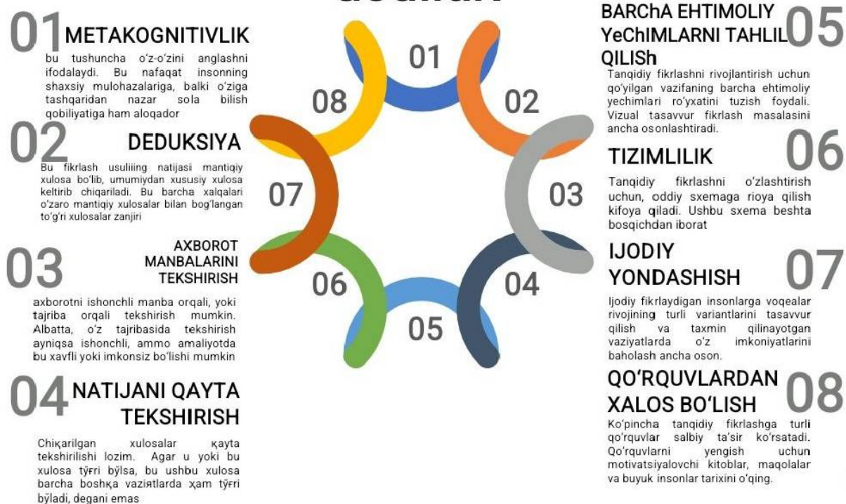
2-chizma. Tanqidiy fikrlashni rivojlantirish usullari