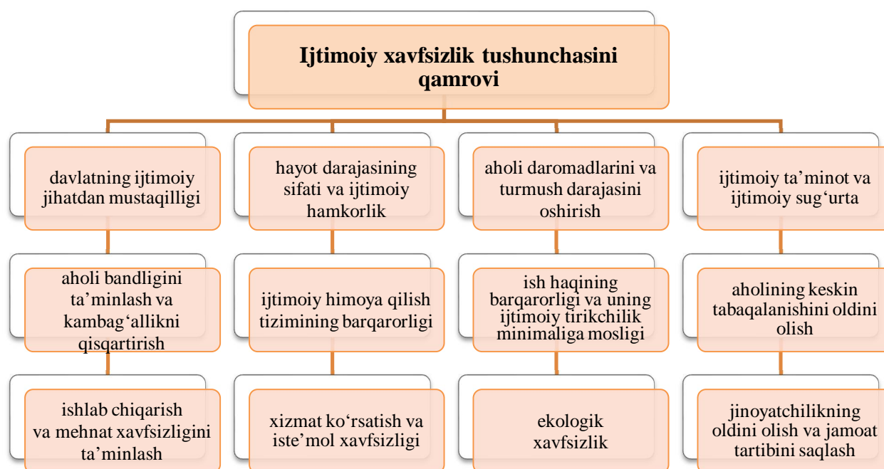
1-rasm. Ijtimoiy xavfsizlik tushunchasini qamrovi

Ko'rsatib o'tilgan yondashuvlardan kelib chiqib, ijtimoiy xavfsizlikni shaxs, ijtimoiy guruhlar va jamoalarning hayotiy muhim manfaatlari, huquq hamda erkinliklariga qaratilgan tahdidlardan himoyalangan holati sifatida izohlash mumkin. Bunday holat ijtimoiy tizimning barqaror faoliyat yuritishi, ijtimoiy muvozanatni saqlash va jamoaviy hamjihatlikni ta'minlashning asosiy shartlaridan biri hisoblanadi. Berilgan mulohazalarni tahlil qilgan holda, ijtimoiy xavfsizlik tushunchasining qamrovini quyidagi yo'nalishlar bo'yicha turkumlab olamiz (1-rasm).