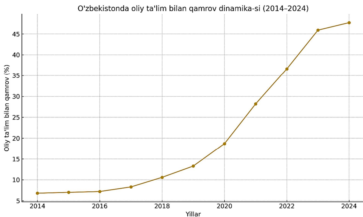
1-rasm. Qamrov dinamikasi (2014-2024) [13]