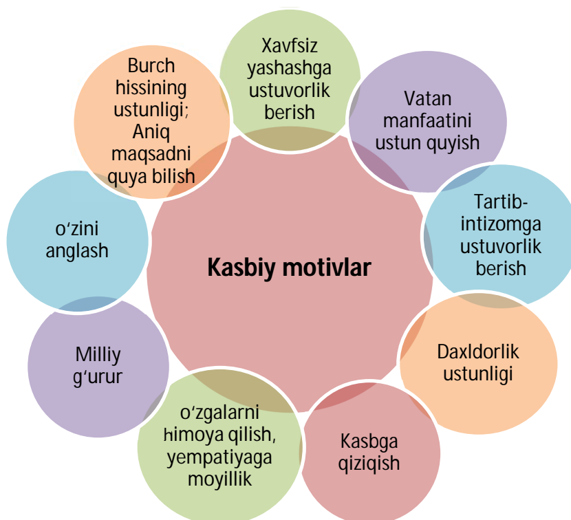
1-chizma. Kasbiy motivlar

Kasbiy faoliyatga motivatsion tayyorgarlik masalalariga bag'ishlangan ishlar subyektning kasbiy faoliyatga motivatsion tayyorgarligi tizimiga shakllantiruvchi element roli berilganligini ko'rsatadi.