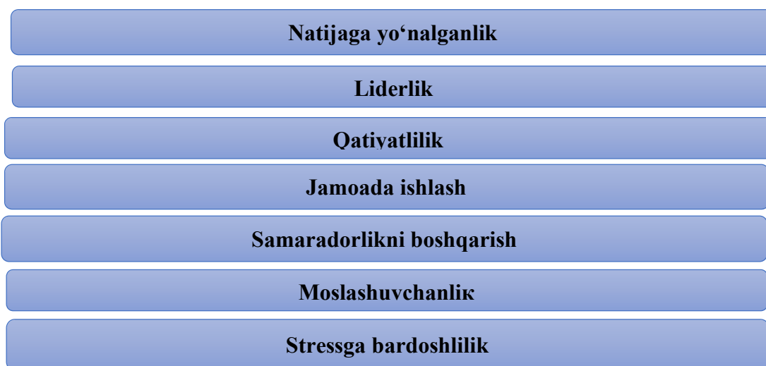
1-chizma. Davlat fuqarolik xizmatchilarining umumiy kompetensiyalari

Ushbu qatnashchilarning “Tanqidiy voqealar” metodi orqali oʻtkazilgan intervyularida oʻzlari duch kelgan muammoli vaziyatlarda asosan yetarli darajada samarali muloqot kompetensiyasiga ega boʻlmaganlari ushbu vaziyatlarni hal etishda qiyinchilik tugʻdirganini taʼkidlanganlar.