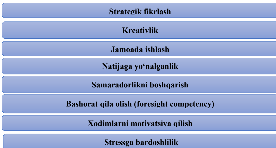
2-chizma. Vazirlik xodimlari uchun asosiy kompetensiyalar

Shuningdek, 24 % vazirlik vakillari bugungi kunda vazirlik xodimlari uchun asosiy kompetensiyalar qatoriga moslashuvchanlik kompetensiyasini kiritish taklifini berishgan. Buning asosiy sababi sifatida vazirliklar va idoralardagi tizimli oʻzgarishlar jarayonida xodimlarni tezda yangi xizmat vazifalariga moslashib samarali ishlashlaridagi qiyinchiliklar koʻrsatilgan.