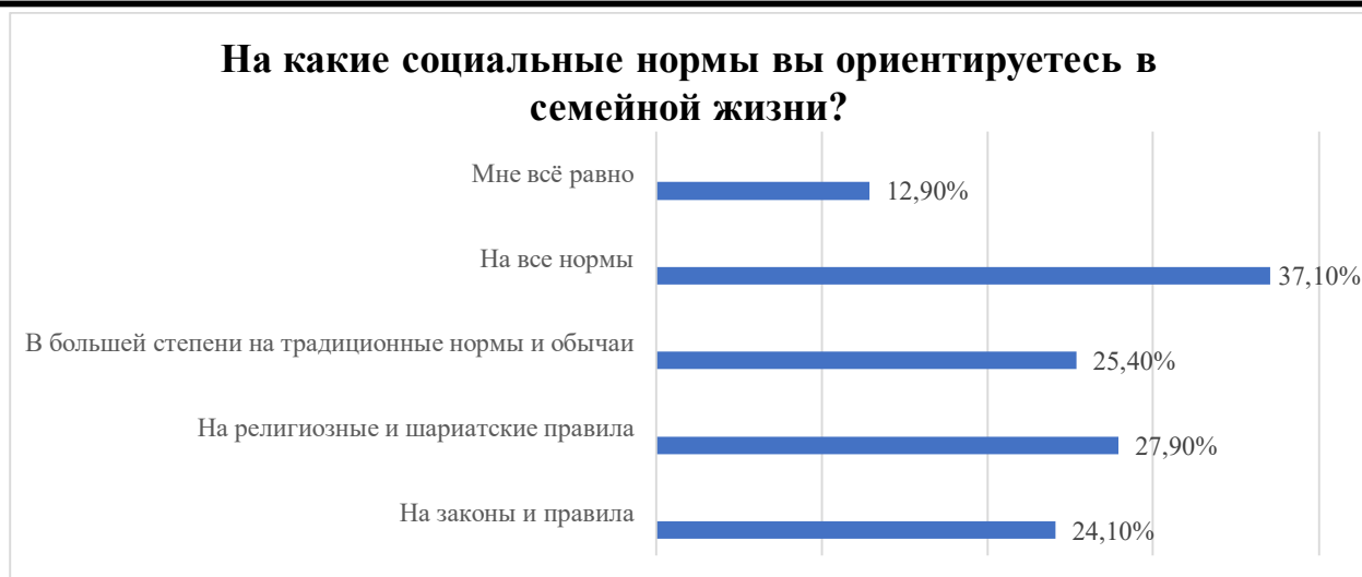
Рис. 1. Мнения респондентов о социальных нормах (в процентах)

Исследования, проведённые Научно-исследовательским институтом семьи и гендера в 2022 году, демонстрируют сложную картину брачных и семейных отношений в Узбекистане, требующую глубокого анализа и понимания для разработки эффективных мер по защите прав женщин и укреплению семейных структур. Большинство браков в Узбекистане заключаются через свах (39,9%), на основе взаимной симпатии (33,9%) и по воле родителей (21%). Этот факт подчеркивает сохранение традиционных практик и влияние культурных норм на брачные отношения. Однако наличие принудительных браков, несмотря на их меньшую распространенность, указывает на продолжение практик, нарушающих права женщин на свободный выбор супруга и автономию в личной жизни.