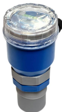
Рисунок 7. Ультразвуковой уровнемер Exensus.3-12 IP65

На рисунке представлена классификация акустических уровнемеров, работающих на основе распространения звуковых или ультразвуковых волн. Эти устройства определяют уровень жидкости по времени прохождения акустического сигнала до поверхности и обратно. Акустические методы являются бесконтактными, что особенно важно при измерении агрессивных, высокотемпературных или загрязнённых жидкостей. Приведённая классификация демонстрирует основные разновидности акустических уровнемеров и подчёркивает их преимущества в условиях, где использование контактных датчиков затруднено или невозможно.