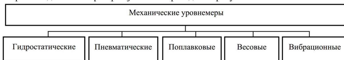
Рисунок 2. Классификация механических устройств измерения и контроля уровня жидкостей

Классификация механических устройств измерения уровня жидких сред приведена на рисунке 2. Пример механического уровнемера Выдвижной датчик уровня на грузе: Мембранный датчик-сепаратор Fuji Electric приведен на рисунке 3.