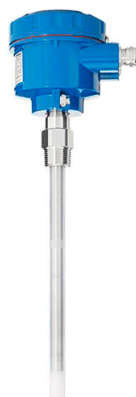
Рисунок 5. NC 8100 A01A3B1Y2 L=500mm Датчик уровня ёмкостный

Данный рисунок отражает классификацию электрических методов измерения уровня, основанных на изменении электрических параметров, таких как сопротивление и ёмкость. Электрические уровнемеры широко применяются благодаря высокой чувствительности, возможности дистанционной передачи сигналов и удобству интеграции в автоматизированные системы управления. Классификация позволяет выделить основные разновидности электрических устройств и определить область их эффективного применения. Использование электрических методов обеспечивает непрерывный контроль уровня жидкости и высокую точность измерений в различных технологических процессах.