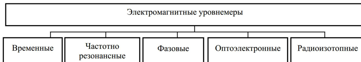
Рисунок 8. Классификация электромагнитных устройств измерения и контроля уровня жидкостей

В электромагнитных уровнемерах используются электромагнитные волны. Классификация электромагнитных устройств измерения уровня жидкости приведена на рисунке 8. Образец электромагнитного уровнемера DFS DMPTM Magnetostrictive Probes представлен на рисунке 9.