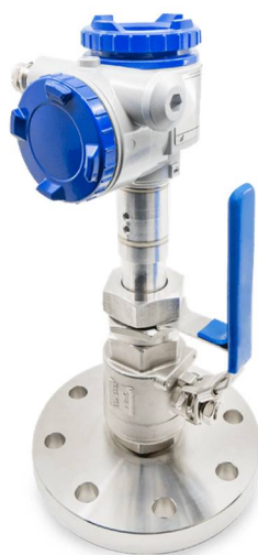
Рисунок 3. Выдвижной датчик уровня на грузе: Мембранный датчик-сепаратор Fuji Electric

*Составлен автором на основе данных источника [5]