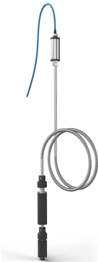
Рисунок 9. DFS DMPTM Магнитостриктивный зонд *Составлен автором на основе данных источника [5]

факторов. Электромагнитные методы широко применяются в сложных технологических условиях, включая высокое давление и температуру. Классификация позволяет систематизировать электромагнитные уровнемеры по принципу действия и области применения, что способствует рациональному выбору средств измерения при проектировании современных автоматизированных систем.