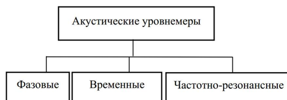
Рисунок 6. Классификация акустических устройств измерения и контроля уровня жидкостей

В акустических устройствах используются звуковые волны. Классификация акустических устройств измерения уровня жидкости приведена на рисунке 6. Образец акустического уровнемера - ультразвуковой уровнемер Exensus.3-12 представлен на рисунке 7.