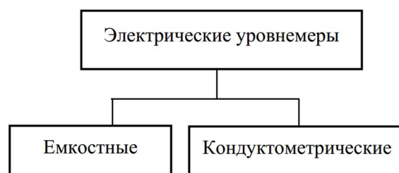
Рисунок 4. Классификация электрических устройств измерения и контроля уровня жидкостей

Классификация электрических устройств измерения уровня жидкости приведена на рисунке 4. Пример электрического уровнемера - ёмкостный датчик уровня NC 8100 A01A3B1Y2 представлен на рисунке 5.