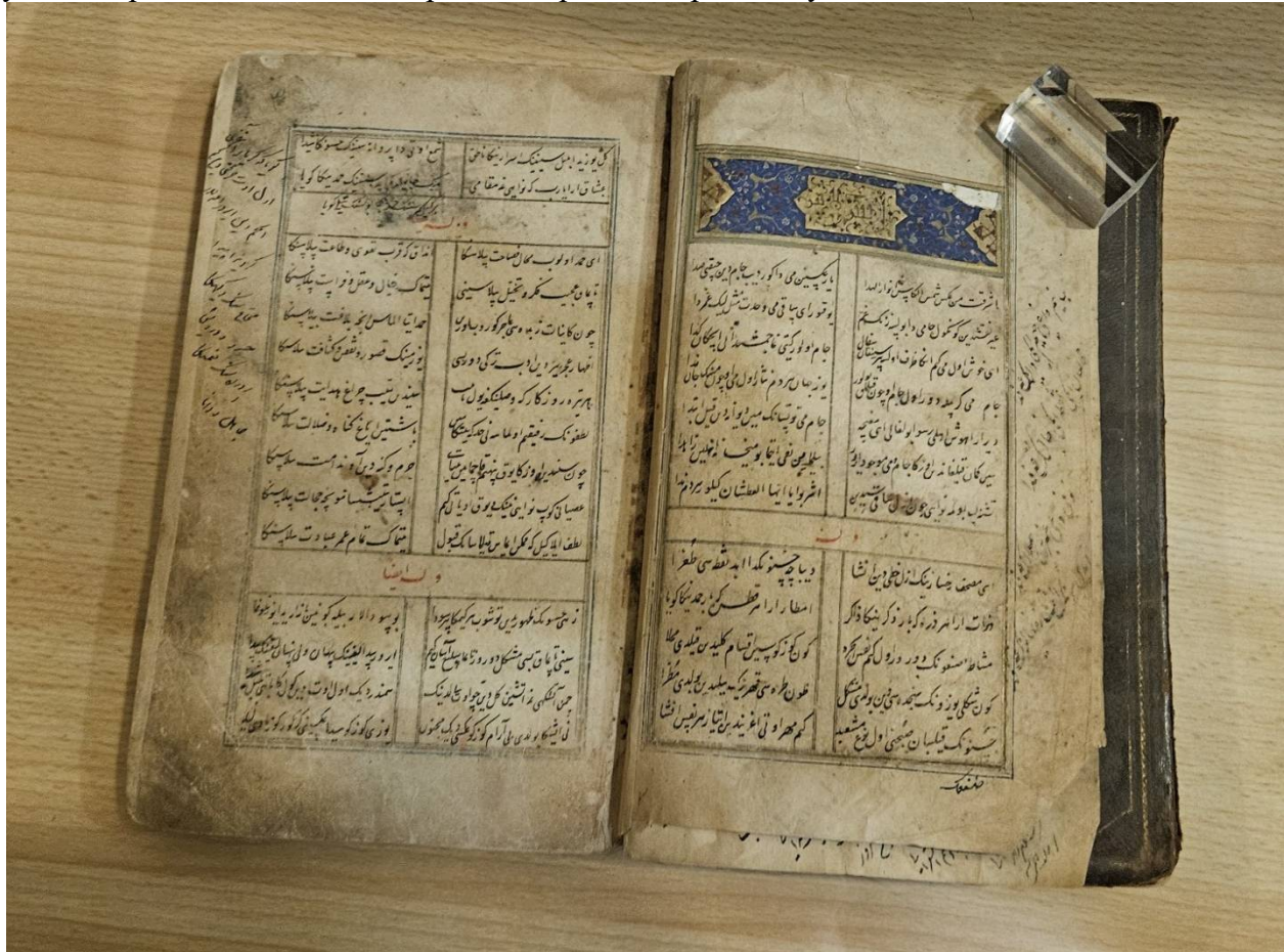
1-расм. Мақоладаги Эрон Миллий кутубхонасида сақланаётган Навоий девони қўлёзмаси

[Erkinov, 2024]. Ҳозиргача Туркияда Навоий асарлари қўлёзмалари кўп нусхаларда учрашини айтиш мумкин эди. Эндиликда улар ёнига Эрон ҳам қўшиш мумкин. Ҳозиргача Эрондаги туркий қўлёзмалар масаласида доктор Шоди Ойдин (Sadi Aydın) томонидан нашр этилган “Эрон кутубхоналаридаги туркий қўлёзмалар каталоги”даги маълумотларга суяниб келганмиз [Aydın, 2008; Derayati, 2010, 792]. Мазкур каталог, айниқса, Эрондаги Навоий асарлари қўлёзмалари ҳақида жуда муҳим маълумотларга эга. Айни пайтда, Эрондаги қўлёзма фондларидан Навоий асарлари қўлёзмаларининг янгидан нусхалари ҳам аниқланмоқда ва мазкур ишларда эронлик олимлар ҳиссаси ҳам бор. Юртимиз олимлар ҳам Эрондаги Навоий қўлёзмалар асосида тадқиқотлар олиб бормоқдалар [Махмудов, 2022; Izzatillaev, 2023].