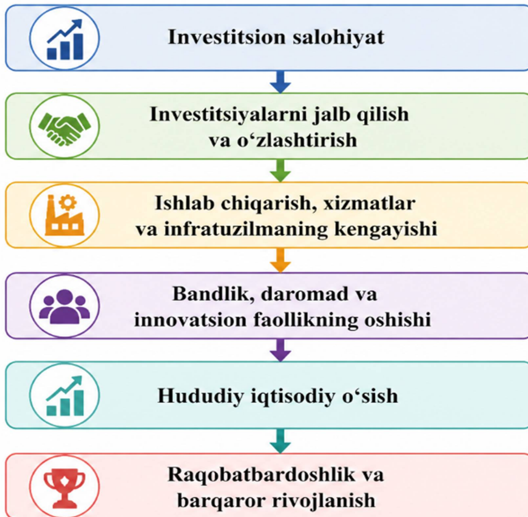
1-rasm. Investitsion salohiyatning hududiy rivojlanishga ta'sir mexanizmi

Mazkur rasmda investitsion salohiyatning hududiy rivojlanishga ta'siri ketma-ket bosqichlar orqali tizimli yondashuv asosida ifodalangan. Modelning boshlang'ich nuqtasida investitsion salohiyat turib, u hududning mavjud iqtisodiy, moliyaviy, infratuzilmaviy va institutsional imkoniyatlarini o'zida mujassamlashtirgan holda asosiy drayver sifatida namoyon bo'ladi.