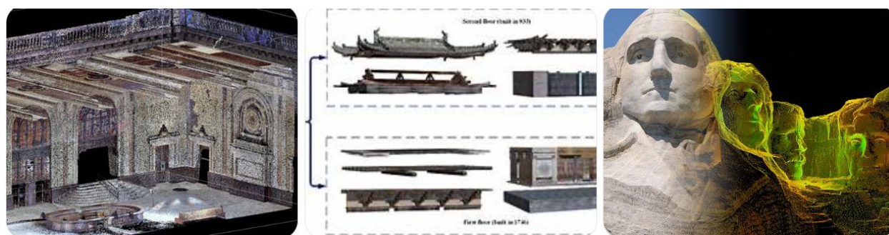
hujjatlashtirish texnologiyalaridan foydalanish jarayoni.