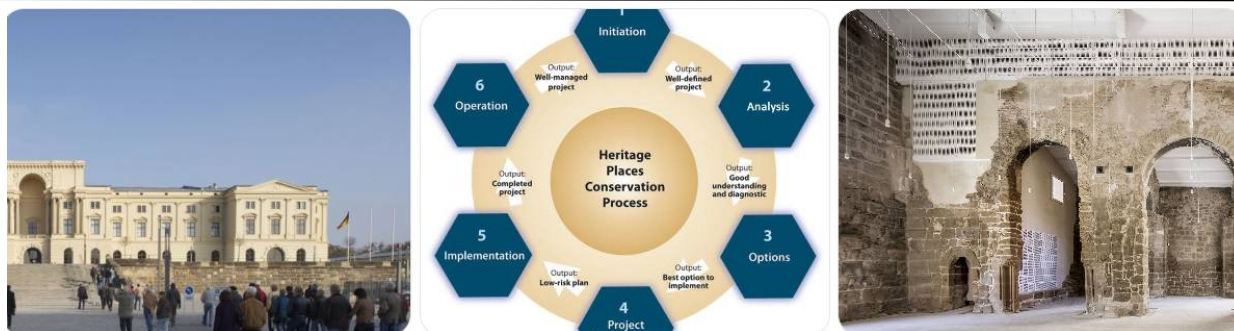
1-rasm. Tarixiy me'moriy yodgorliklarni konservatsiya qilish jarayonida minimal aralashuv va autentiklikni saqlash tamoyillarining qo'llanilishi.