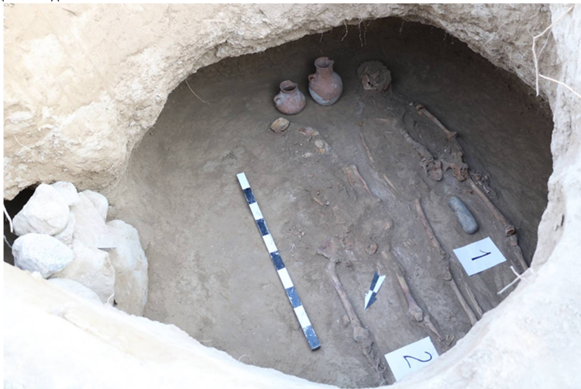
2-расм. Кандирсойдан топилган қабрнинг умумий кўриниши

Хулоса қилиб айтганда, Кандирсойдаги мазкур археологик топилма Тошкент воҳасининг антик даврдаги маданий, диний ва этник ҳаётини ёритувчи янги, муҳим археологик манбалардан бири бўлиб, бу худуднинг қадимий аҳамиятини янада мустаҳкамлайди.