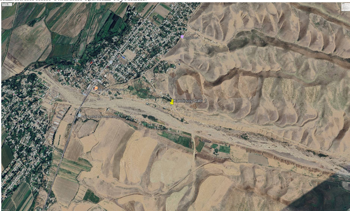
1-расм. Қабрнинг “Googel earth” дан кўриниши

Ўрганилган қабр ва ундан топилган сопол идишлар Тошкент воҳасида кенг тарқалган Қовунчи маданияти материаллари билан жуда яқин. Айниқса, сопол идишларнинг ясалиши, тузилиши ва пардозланишига кўра бу сопол идишлар Қовунчи маданиятининг иккинчи (II–IV асрлар) босқичидаги идишларга жуда яқин [Левина, Л.М. 1971. – 263]. Шуларга асосланиб янги, тасодифан топилган қабрни ва ундаги топилмаларни II–IV асрларга тегишлилигини тахмин қилиш мумкин.