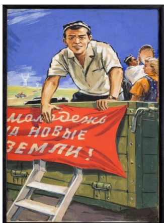
5-rasm. Yoshlar, yangi yerlarga! Rassom A.S. Rossal.

Yangi o'zlashtirilayotgan yerlarga aholini ko'plab jalb etish maqsadida ko'chib boruvchilarga beriladigan imtiyozlar, ularni moliyaviy jihatdan qo'llab quvvatlashga doir chora-tadbirlar ham plakatlar yordamida ham yoritilib borilgan. Jumladan, 1958-yil Toshkentda chiqarilgan "Mirzacho'l, Markaziy Farg'ona, Surxondaryo oblasti va Qoraqalpog'iston ASSRda yangi o'zlashtirilayotgan yerlardagi kolxoz va sovxozlarga ko'chib boringiz!" deb nomlangan plakatda yangi yerlarga ko'chib boruvchi oilalarga ko'chib borgan hududiga ko'ra 3, yoki 4 yil mobaynida qishloq xo'jaligi soliqlaridan ozod qilinishi hamda Mirzacho'lga kelgan oilalarning oila boshlig'iga 600 so'mdan va oila a'zolarining har biriga 200 so'mdan naqd pul berilishi ko'rsatilgan (3-rasm). Bundan maqsad esa qo'riq yerlarni ham aholi gavjum hududlardan biriga aylantirish va yangi manzilgohlar yaratib, paxta dalalarini kengaytirish edi.