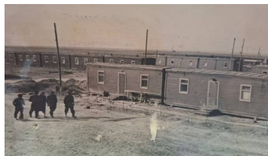
8-rasm. Quruvchilar yashashi uchun vagonlardan iborat yotoqxona. 1957 yil.