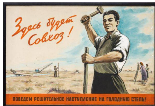
4-rasm. Bu yerda sovxoz bo'ladi! Mirzacho'lga qay'iy hujum boshlaymiz! Rassom. A.S. Rossal-Voronov.