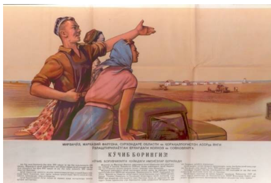
3- rasm. Mirzacho'l, Markaziy Farg'ona, Surxondaryo oblasti va Qoraqalpoq ASSRda yangi o'zlashtirilayotgan yerlardagi kolxoz va sovxozlarga ko'chib boringiz! Toshkent: O'zdavnashr, 1958.

Mirzacho'lda tashkil topayotgan yangi xo'jaliklarni ishchi kuchi va mutaxassislar bilan ta'minlashga doir targ'ibot ishlari muntazam kuchaytirib borildi. Aholini cho'lni o'zlashtirish jarayoniga safarbar etish mavzusiga bag'ishlangan plakatlar O'zSSR Ministrlar Soveti qoshidagi "Ko'chirish va ishchilarni ishga olishni tashkil etish bosh boshqarmasi"ning buyurtmasiga ko'ra tayyorlangan. Bunga misol qilib quyidagi plakatlarni ko'rsatish mumkin: Mirzacho'l va Markaziy Farg'onadagi yangi sug'orilgan yerlarda tashkil qilingan sovxoz va kolxozlarga ko'chib boringiz. Rassom N. Sherstnev. – Toshkent: O'zdavnashr, 1960; Переселяйтесь в колхозы и совхозы для освоения новых земель! Художник В. Котлов. – Ташкент: Госиздат УзССР, 1959; Переселяйтесь в совхозы и колхозы, организованные на землях нового орошения Голодной степи и центральной Ферганы. Художник Н. Шерстнев. – Ташкент: Госиздат УзССР, 1960; Yangi yerlar cho'lquvarlarni chorlaydi. Rassom A. Balkanov. O'zSSR mehnat bo'yicha davlat komiteti. – Toshkent: nashriyotsiz, 1979; Освоение Голодной степи – дело рук твоих, молодежь! Худож. В. Бреице. Текст М. Ушакова [8,9].