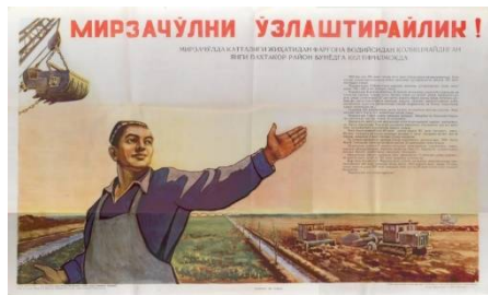
2-rasm. Mirzacho'lni o'zlashtiraylik! Rassom: Sherstnev N. Toshkent: O'zdavnashr, 1958