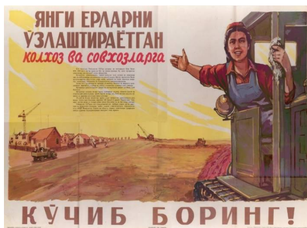
6-rasm. Yangi yerlarni o'zlashtirayotgan kolxoz va sovxozlarga ko'chib boringiz! Rassom: B. Kotlov. Toshkent: O'zdavnashr 1959.

Mirzacho'lni o'zlashtirishga otlangan cho'lquvarlarni asosan yoshlar tashkil etgan. Komsomol tashkilotlari ko'ngilli yoshlarni qo'riq yerlarga jalb etish borasida katta ishlarni amalga oshirgan. Ba'zi yoshlar romantika tufayli, boshqalari mustaqillikka intilish sabab cho'lga yo'l olgan, ammo ularning barchasini mamlakatga yordam berish istagi birlashtirgan.