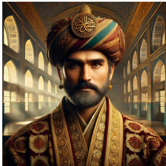
Рис. 1. Сгенерированный портрет Убайдуллахана на основе ИИ-ChatGPT

«Создай портрет правителя бухарского ханства Убайдуллахана по следующим характеристикам: (вставляется выше предоставленный текст-портрет о достижениях и личности Убайдуллахана)». После этого изображение было сгенерировано следующим образом: