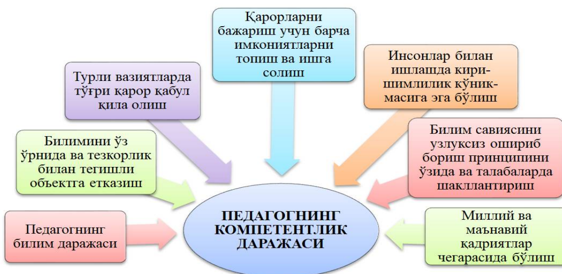
1-расм. Педагогнинг компетентлик даражаси белгиловчи унсурларнинг ўзаро боғлиқлиги

Таълим берувчилар ўртасида ҳам рақобат бўлиши керак. Бунга таклиф кўп бўлиши лозим. Мамлакатимизда педагог мутахассислар тайёрлайдиган ОТМлар етарли даражада. Ўша ОТМлар билан шартномалар тузиб, зарур бўлса билимли бўлажак мутахассисларнинг шартнома пулларини тўлаб, ўзлари иш билан таъминласа, талабалар ўртасида ҳам рақобат пайдо бўлади. Яхши билим олган талабанинг иш жойи аниқ. (Бу амалиёт баъзи ишлаб чиқариш корхоналарида мавжуд). Таълим жараёнининг узвийлиги, давлат таълим стандартлари мавжуд бўлиб, у барча таълим муассасалари учун бирдек амал қилади. Давлат таълим стандартларидаги таълим жараёнининг узвийлигига яна бир қараб чиқиш керак. Юқорида айтилганидек, такрорланишларга чек қўйиш керак. Ҳозирги вақтда ОТМда қайсидир фанга ўз хиссасини қўшган олимлар, фан докторлари фаолият олиб боради. Унинг илмий ишлари ва яратган янгиликларидан ҳамма фойдаланади. Лекин, қайсидир фан учун бошқа марказдаги ОТМ ўқитувчилари томонидан яратилган намунавий дастур бўйича дарс ўтилиши керак. Улар ҳам адабиётларга ўзлари нашр қилган адабиётларни киритиб қўяди. Ва айнан ўша адабиёт ОТМ АРМИда мавжуд бўлиши, дарсни ўша адабиётлардан ўтиши керак бўлади. ОТМлар учун таълим бериш жараёнидаги ўқув режалар, намунавий дастурларни ўзлари ишлаб чиқиши ва дарсларни ташкил этишни ўзлари белгилаши керак. Чунки рақобат шароитида бир хил маҳсулот билан эмас, бир турдаги бошқа кўринишдаги маҳсулот билан бозорга чиқиш керак.