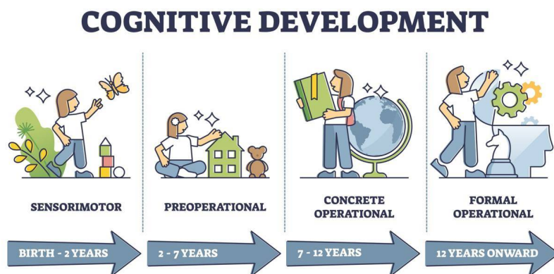
1-rasm. J. Piaje bo‘yicha kognitiv rivojlanish bosqichlarining nutq bilan bog‘liqligi.

Ulardan farqli o‘laroq, Piaje bola biror so‘zni ishlatishi uchun avval o‘sha so‘z ma‘nosini tushunishi kerakligini ta’kidlaydi[8]. U “suv va idish” tajribasi asosida buni aniqroq tushuntirib beradi. Piaje bolaning oldiga ikkita bir xil stakanda teng miqdorda suv qo‘yadi. Bola “Ikkalasida ham suv bir xil” – deydi. Keyin bola ko‘z o‘ngida stakanlardan biridagi suvni uzun va ingichka idishga quyadi. Bola “Uzun idishda suv ko‘paydi” – deb aytadi. Piaje bu holatni bolaga tushuntirib bo‘lmasligini qachon u miqdor haqida tasavvurga ega bo‘lsagina buni tushuna olishini ushbu tajribasi orqali yanada aniqroq ko‘rsatib beradi. Xulosa qilib aytganda, Piaje nutq o‘zlashtirilishini kognitiv rivojlanishning ajralmas qismi sifatida isbotlab berdi.